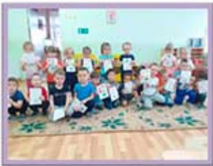
Рисование «Наши фруктовые друзья»

Воспитатель, МАДОУ детский сад №22, г. Туймазы, Республика Башкортостан