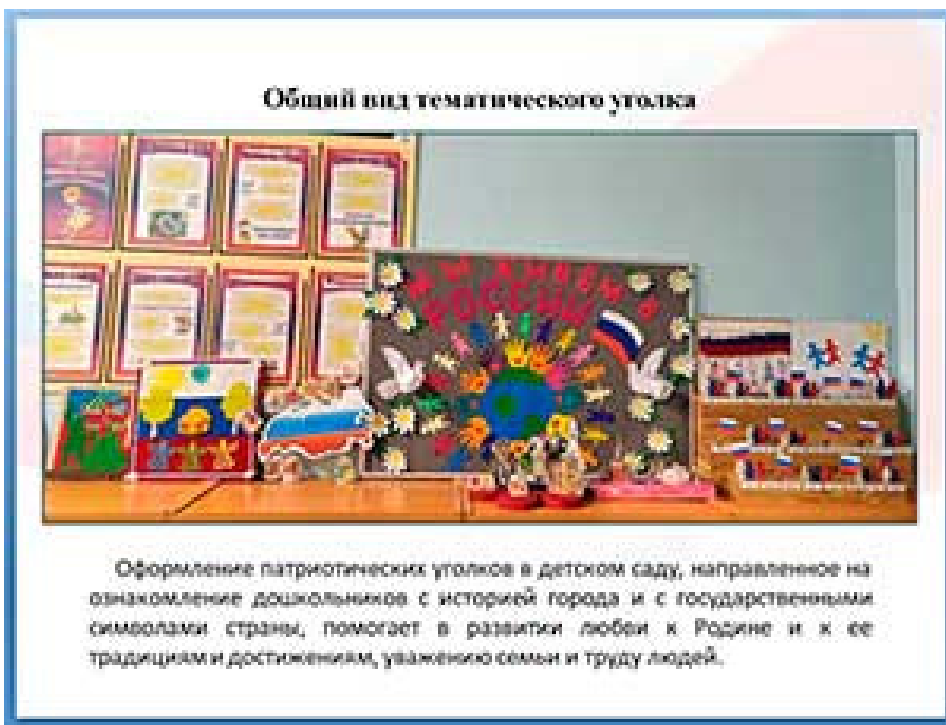
Оформление патриотических уголков в детском саду, направленное на ознакомление дошкольников с историей города и с государственными символами страны, помогает в развитии любви к Родине и к ее традициям и достижениям, уважению семьи и труду людей.

На левой стороне тематического уголка расположены работы совместного детско-родительского творче-